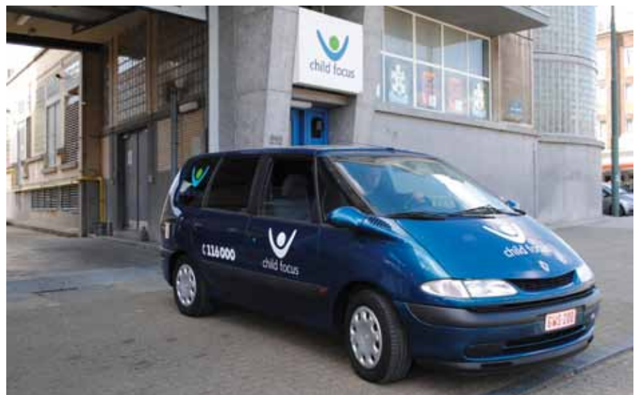
De « Childmobile » is het interventievoertuig van Child Focus voor de productie van affiches op de plaats van de verdwijning.

Als Child Focus in het belang van het kind discreter te werk moet gaan, dan kunnen er vignetten gebruikt worden in plaats van affiches. Een vignet is een miniaffiche die gemakkelijk in een portefeuille of achter een toonbank past. Vrijwilligers verdelen vignetten onder zorgvuldig geselecteerde doelgroepen (taxibestuurders, stationschefs, handelaars enz.). Een vignet wordt niet uitgehangen en is dus niet voor iedereen zichtbaar. In een poging om getuigenissen te verzamelen, helpen al die partners ons om een kind zo snel mogelijk terug te vinden. Zonder hen, zijn wij niets.