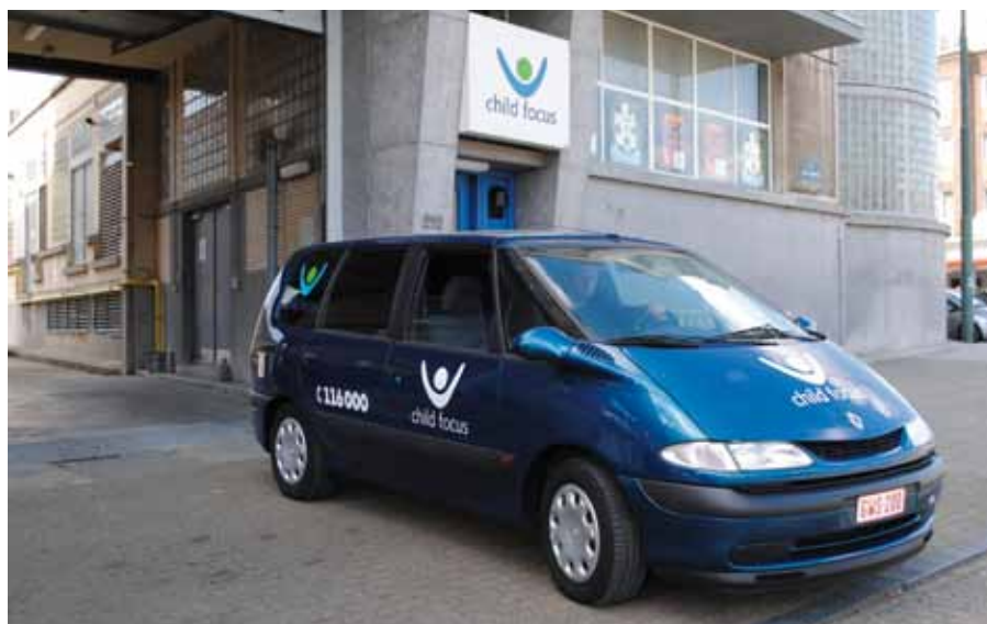
La « Childmobile » est le véhicule d'intervention de Child Focus pour produire des affiches sur le lieu de la disparition.

Si, dans l'intérêt de l'enfant, il faut agir d'une façon plus discrète, Child Focus recourt à un vignettage plutôt qu'à un affichage. La vignette est une mini affiche, facile à glisser dans un portefeuille ou sous un comptoir. Les volontaires se chargent de la distribuer auprès de groupes cibles soigneusement sélectionnés (taximen, chefs de gare, commerçants, etc.). La vignette n'est pas visible pour le grand public. En tentant de susciter des témoignages, tous ces partenaires aident à retrouver au plus vite l'enfant. Sans eux, nous ne sommes rien.